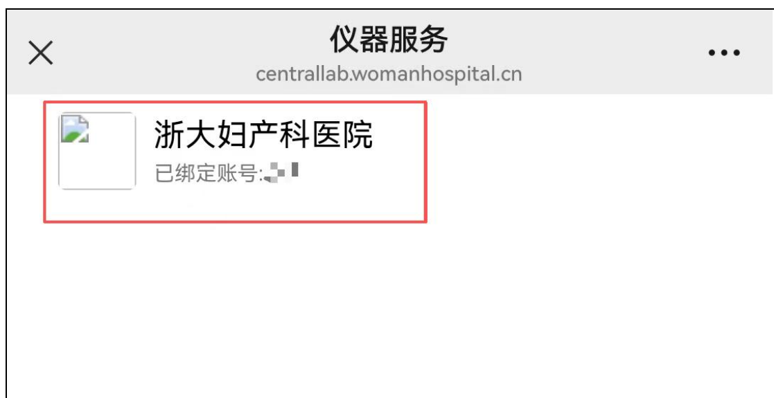
图 2：仪器服务界面，点击浙大妇产科医院。

(5) 现在培训多工作时间，部分时间较难参与；仪器是否可以像 PCR 类似做成标准化流程图；在院仪器操作、常规实验步骤是否可由实验老师制作标准操作放在实验官网或仪器旁自助扫描学习。